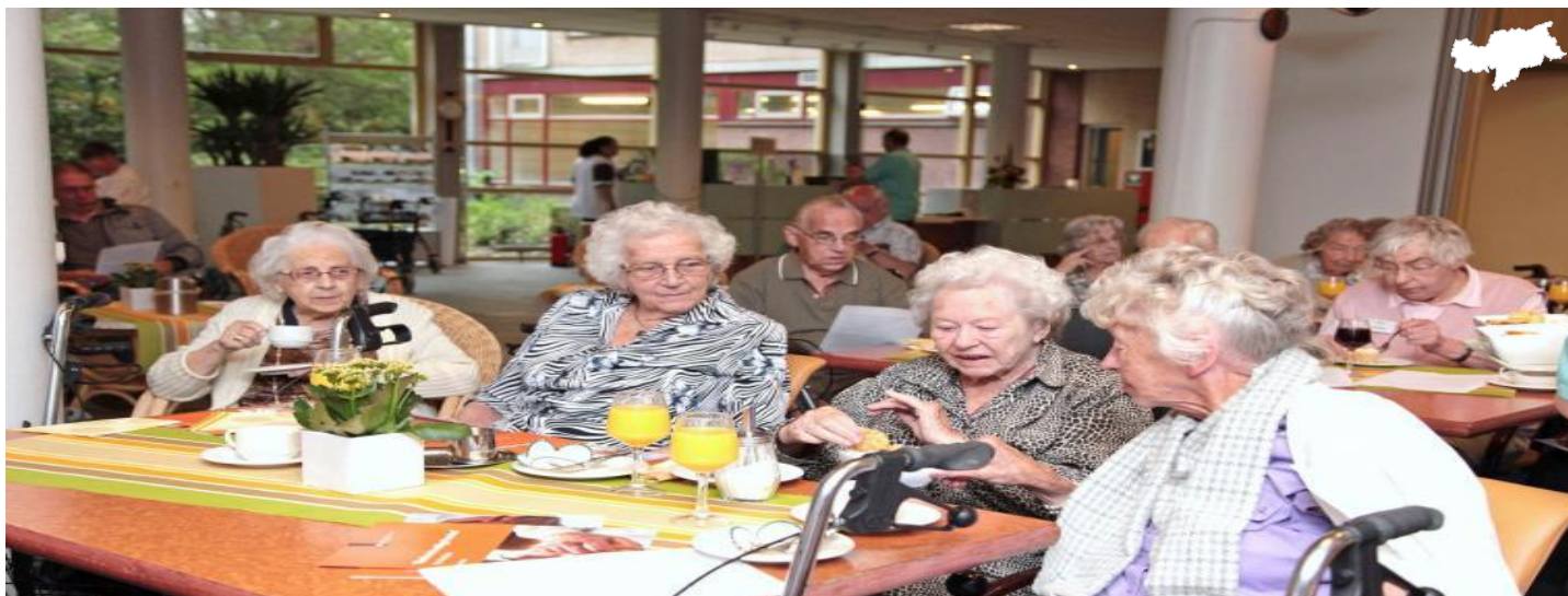
Die Seniorenheime und Senioren erfahren viel Solidarität von der Südtiroler Bevölkerung. (Symbolbild)