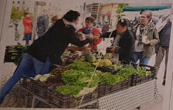
Ritornano i mercati settimanali e quelli dei contadini