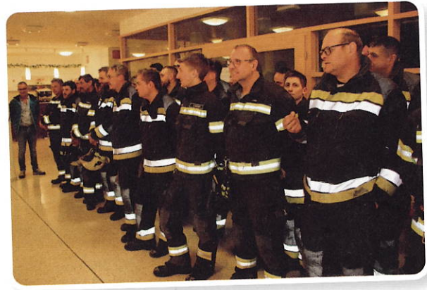
Allseits zufriedene Gesichter nach getaner Arbeit bei der gemeinsamen Nachbesprechung. Danke der Feuerwehr für die Zusammenarbeit!