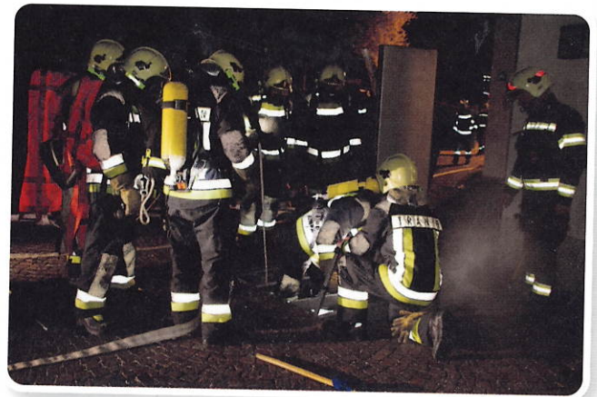
Zu Übungszwecken wird der schwierige Zugang über einen Lüftungsschacht gewählt.