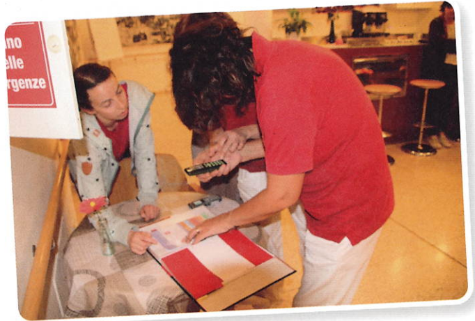
Die Einsatzkräfte werden alarmiert.