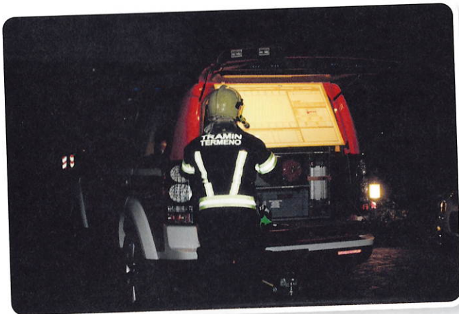
Schon bald ist die Feuerwehr vor Ort und beginnt mit der Brandbekämpfung.