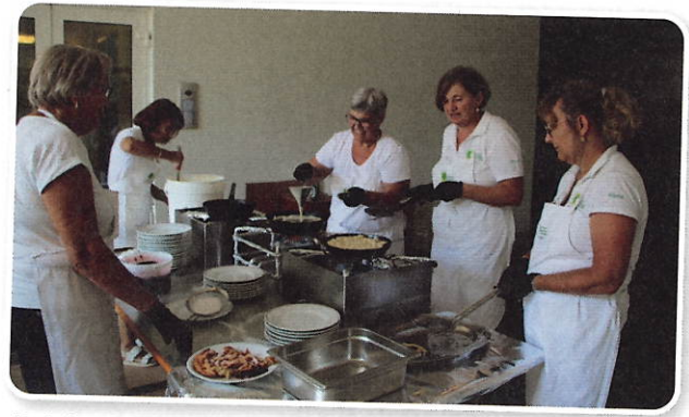
Bei der Zubereitung des Straubenteigs ...