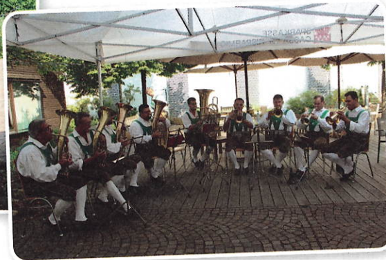
Die Traminer Böhmische umrahmte den Gottesdienst und sorgte auch danach noch für musikalische Unterhaltung.