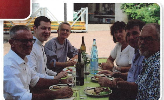
Verantwortliche von Altenheim, Pfarrei und Gemeinde an einem Tisch.