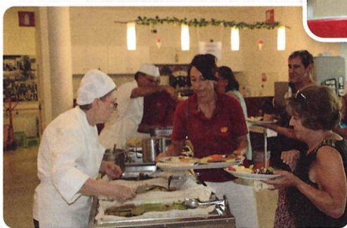
MitarbeiterInnen aus Küche und Pflege sorgten für das leibliche Wohl der Gäste.