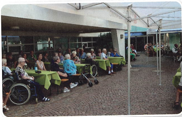
Aufmerksame Zuhörerinnen und Zuhörer lauschten den Klängen der Böhmischen.