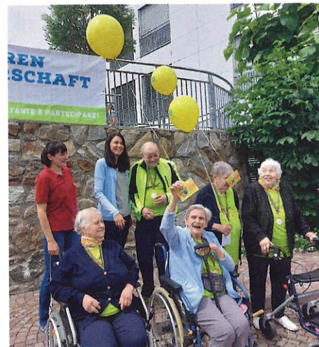
Am Ende der Veranstaltung wurden Grußbotschaften in die Lüfte geschickt.