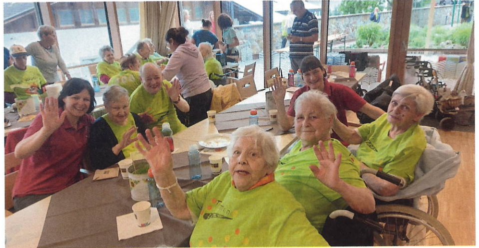
Die Gruppe aus Tramin zuversichtlich und heiter bei einem stärkenden Kaffee.

Die Veranstaltung stellt auch eindrucksvoll unter Beweis, dass hinter der Arbeit der Mitarbeiterinnen und Mitarbeiter der Südtiroler Seniorenwohnheime viel Hingabe und Einsatz stecken. Die Heime werden damit ihrem sozialen Auftrag mehr als gerecht.“